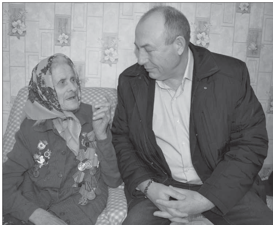
■ Глава внимательно выслушал ветерана

Есть у него и планы помельче, но воплощения их в жизнь жители поселения