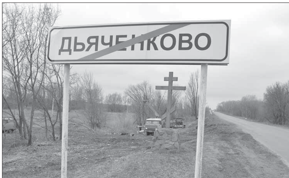
■ Обзор дорожного полотна теперь будет прекрасный