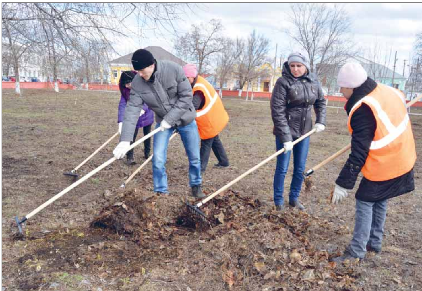
В порядок приводится городской парк – любимое место отдыха богучарцев

Жители Богучарщины активно приступили к работам по благоустройству родного края